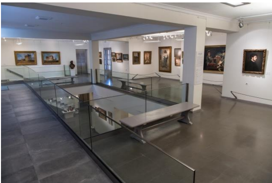
Averoff Museum, Metsovo

Marathondromon Av. 59 15452 Psychiko. Athens, Greece Tel. +30 210 6778244 Email: averoff@otenet.gr