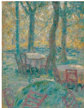
Ivan Grohar. Le Jardin de Stermaje. 1907 National Gallery, Ljubljana